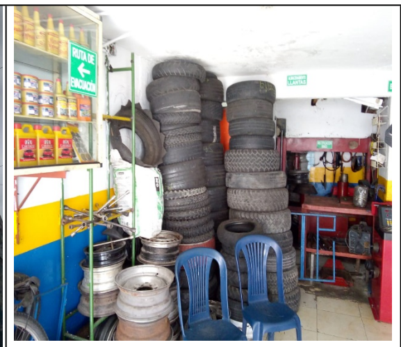
Foto 4. Vista general del acopio de llantas.