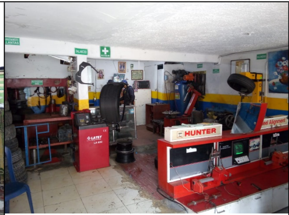
Foto 2. Vista general del establecimiento.