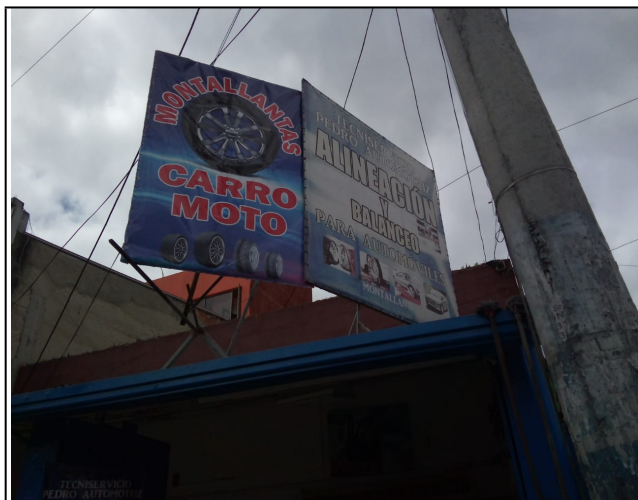
Foto 3. Vista general de la Publicidad Exterior Visual.